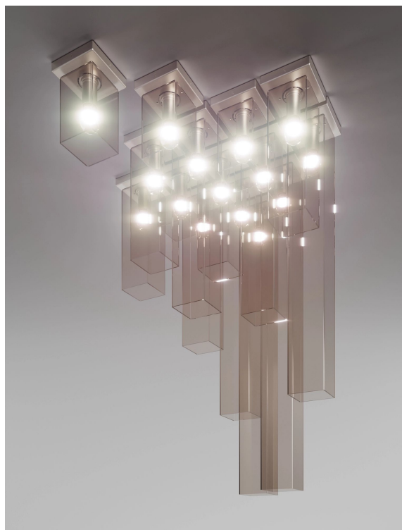
TUBES PL 15 FUTR NO E27 CE