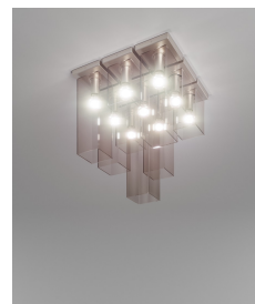
TUBES PL 9