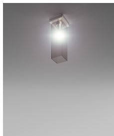
TUBES PL 40