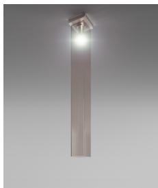
TUBES PL 120