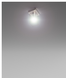
TUBES PL 20