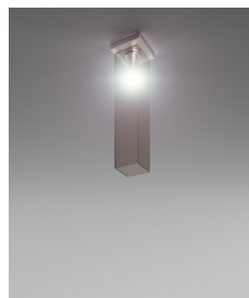
TUBES PL 60