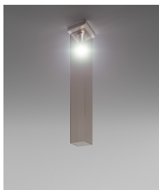
TUBES PL 90