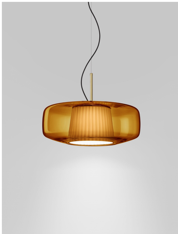
PLISS SP G ADPS AVS L22 CE