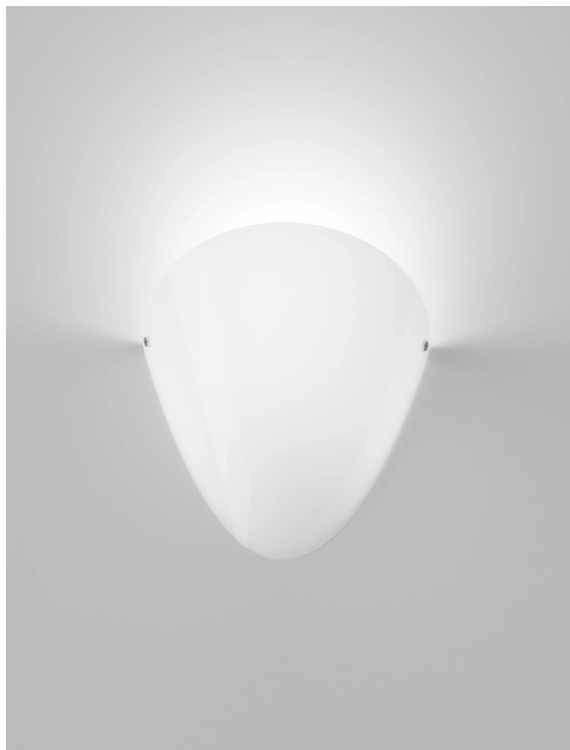
OVALI AP BCLU 000 E27 CE