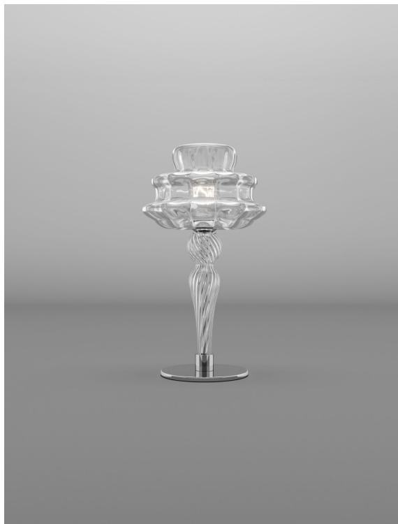
NOVEC LT CRRI CR 14E CE