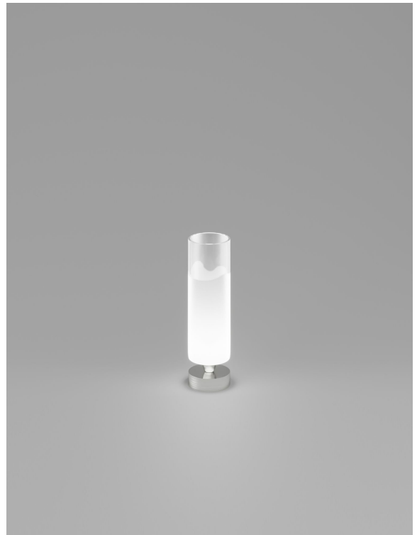
LIO LT P CRBC NI G9 CE